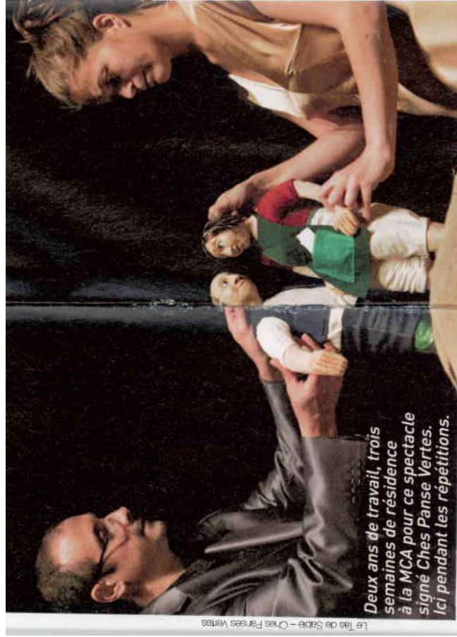
Le Tas de Sable - Ches Panses Vertes Deux ans de travail, trois semaines de résidence à la MCA pour ce spectacle signé Ches Panses Vertes. Ici pendant les répétitions.