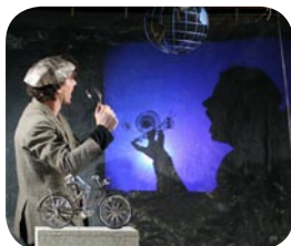
La mer en pointillés