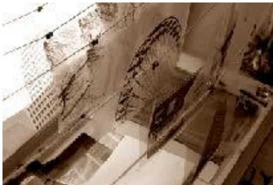
Photos de la maquette

Photographie, théâtre d'ombres, transparence, lumières en couleurs, musique. Plusieurs éléments pour créer une histoire dédiée au jeune public à partir de 6 ans. Une histoire écrite au fil des résidences, grâce aux recherches de plateau. La scénographie représente 13 photos en noir et blanc (1,25m x 2m) imprimées sur une matière transparente et suspendues en plusieurs couches, l'une derrière l'autre. Ce dispositif crée une profondeur et un espace 3D en utilisant des images 2D. Grâce à la lumière, cet espace se transforme en théâtre d'ombres géant en 3D.