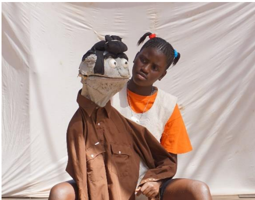
Photo 10 et 11: Yaakaar Module 5 - Manipulation et jeu avec marionnettes