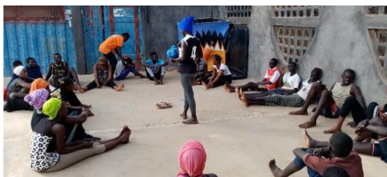
Photo2 : Yaakaar module 2 – Initiation à la construction et manipulation marionnette