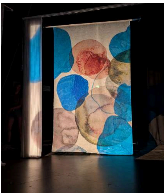
résidence de recherche · Charleville-Mézières · juillet 2025

Nous l'envisageons pour un public à partir de 10 ans (en tout public et/ou en scolaire)