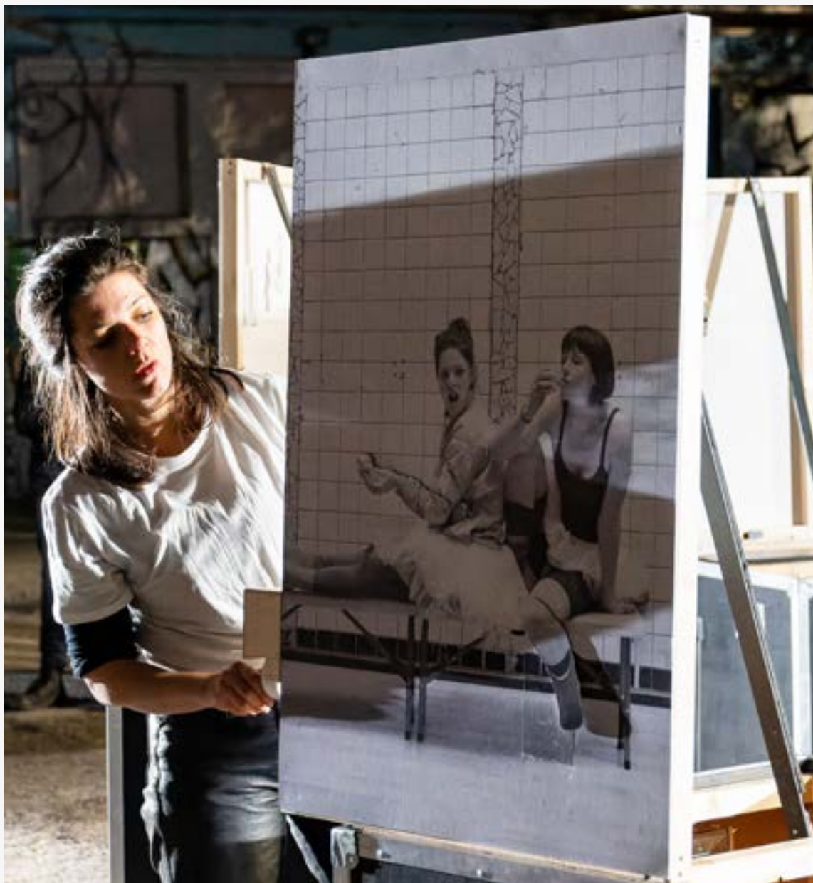
Photographie mécanisée par Audrey Robin. Image prise par (c) Manon Bugaut lors d'une étape de travail du spectacle «20ème rue ouest» au CNAREP Chalon dans la rue, avril 2023