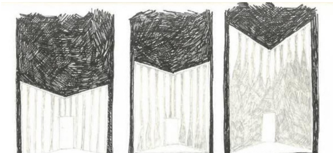
Maquette et dessin par François Gauthier-Lafaye, scénographe